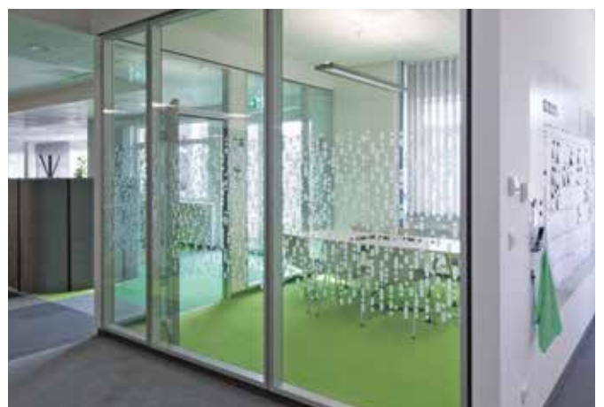
Individuelle Dekorfolienbeklebung eröffnet vielfältige Gestaltungsmöglichkeiten