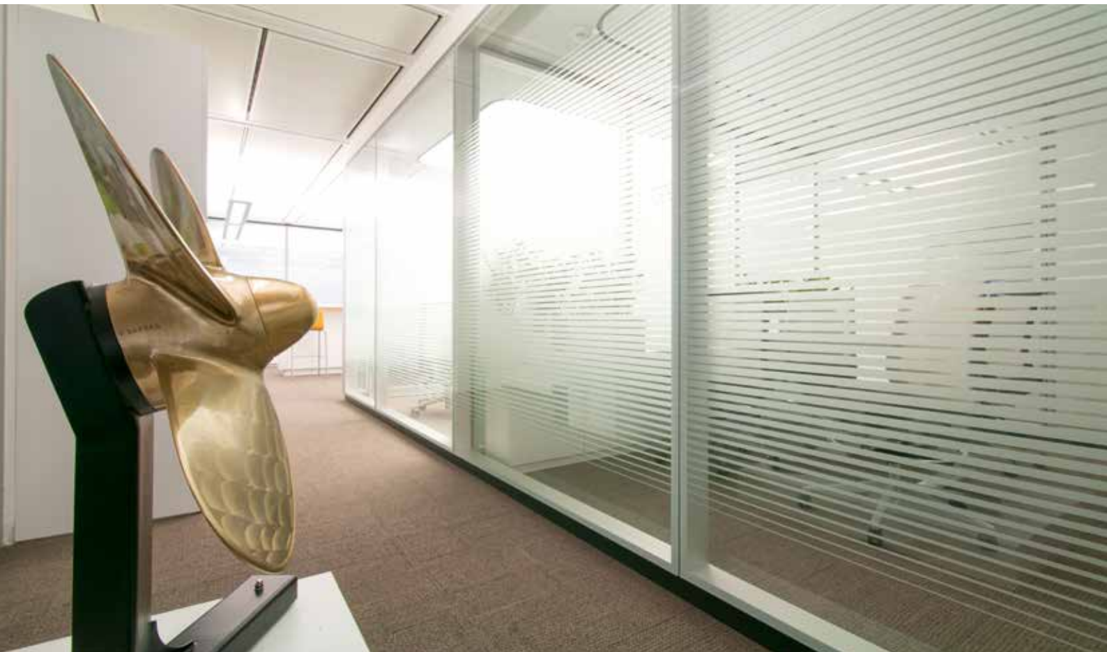
Linienraster – ein edles Gestaltungselement.

Die Glasdekorfolien werden werkseitig im Scheibenzwischenraum aufgebracht und sind dadurch praktisch wartungsfrei. Die Motive können individuell auf die Bedürfnisse und die Wünsche des Kunden angepasst werden.