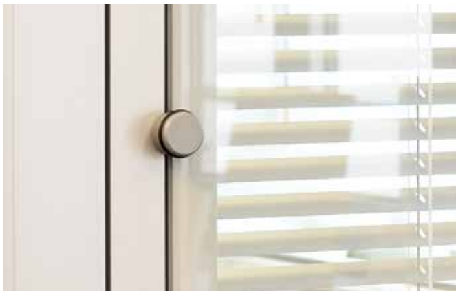
Jalousien manuell, dreh- und wendbar mittels Drehknopf